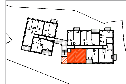
T3 - B106 - R+1