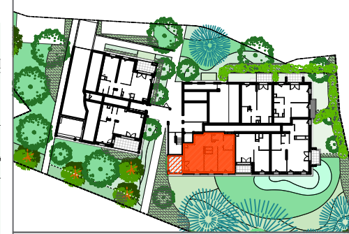
T3 - B005 - RDC