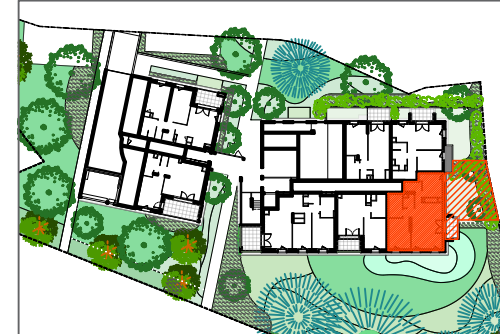
T3 - B003 - RDC