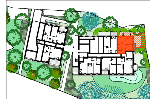
T2 - B002 - RDC