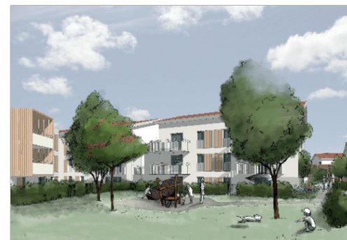
Bâtiment A3 - R+2- N° A206 - T4