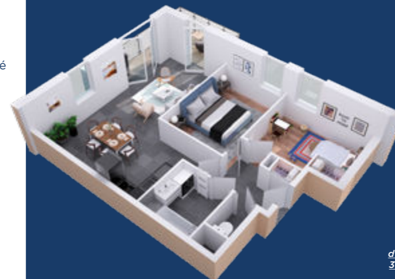
Exemple d'un appartement 3 pièces lot 402J

Au cœur d'un véritable parc arboré de 6235m 2 d'espaces verts, UNISSON invite ses habitants à se reconnecter avec la nature ! En plus d'un potager partagé et d'un verger composé de pommiers, de poiriers et d'abricotiers, pas moins de 122 arbres forment une authentique canopée sous laquelle se trouvent des promenades et des traçages de jeu d'enfant au sol. Les logements en accession seront tous positionnés dans un bâtiment de 27 appartements du 2 au 4 pièces. Pour inviter les résidents à se rapprocher de la nature, les pièces de vie sont toutes prolongées par un balcon ou une terrasse donnant directement sur les aménagements paysagers.