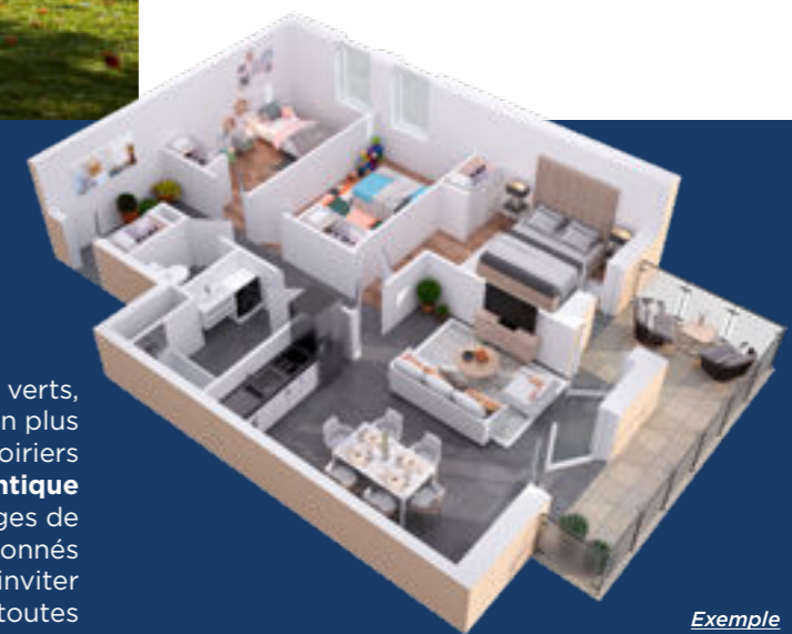
Exemple d'un appartement 4 pièces lot 304J

Emmanuel Rigaldiès pour And Co Architectes