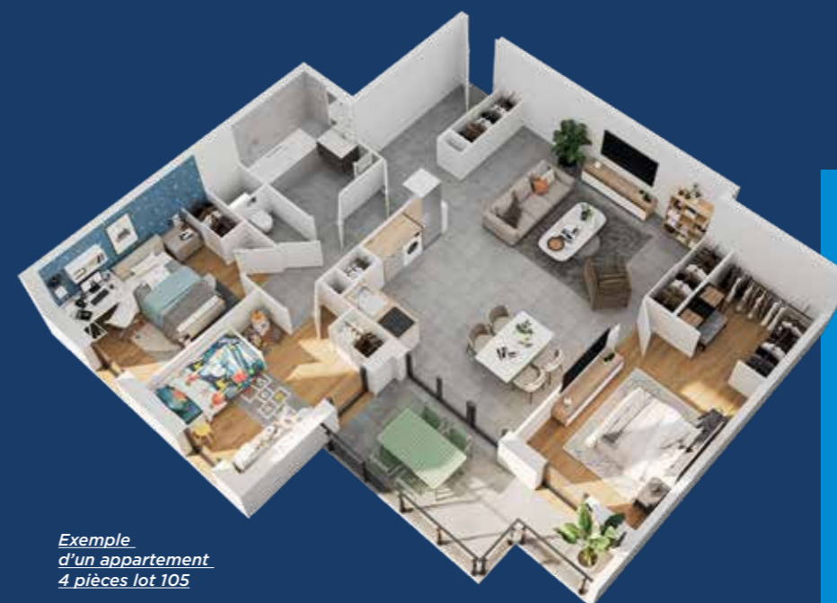
Exemple d'un appartement 4 pièces lot 105

À deux pas du cœur de Quincieux, la résidence Mélo a hérité d'une adresse très recherchée pour son accessibilité et son voisinage exclusivement composé de villas individuelles. Pour faire écho à cet environnement calme et résidentiel , Mélo arbore un style traditionnel avec une toiture à deux pans et des enduits clairs allant du gris au beige, alors que des volets coulissants et des garde-corps vitrés apportent une touche contemporaine . Idéale pour tous les projets de propriété , la résidence accueille une crèche au rez-de-chaussée, des appartements du 3 au 5 pièces avec balcon, terrasse à ciel ouvert au dernier étage ou jardin privatif entouré de haies végétalisées .