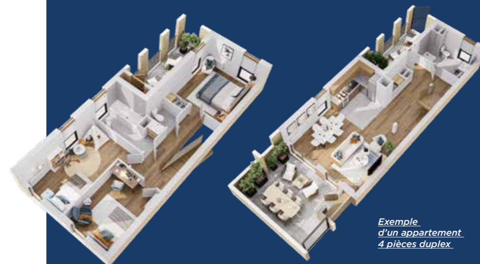
Exemple d’un appartement 4 pièces duplex