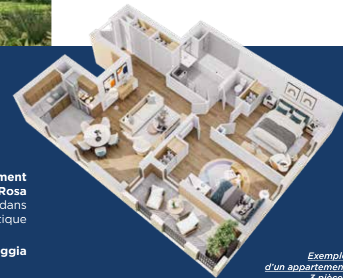
Exemple d’un appartement 3 pièces

Dans l’air du temps, l’agencement intérieur s’articule autour d’une grande cuisine ouverte, véritable pièce de vie et de partage destinée aux moments de convivialité.