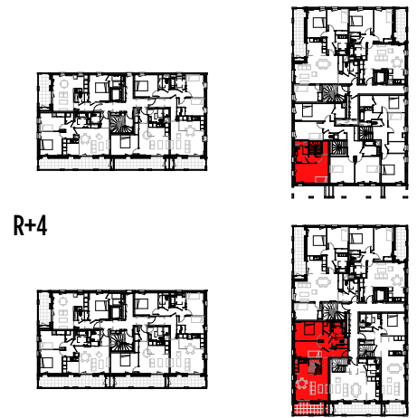
Tableau des surfaces habitables