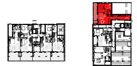
Tableau des surfaces habitables