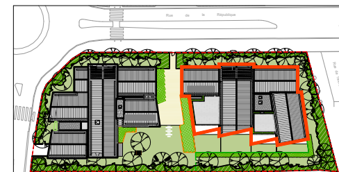
Bâtiment B - R+2- N° B202 - T3