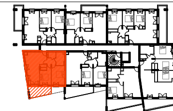
Plans de repérage

La surface des placards est incluse dans les surfaces des pièces attenantes