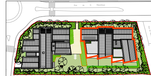
Bâtiment B - R+2- N° B201 - T3