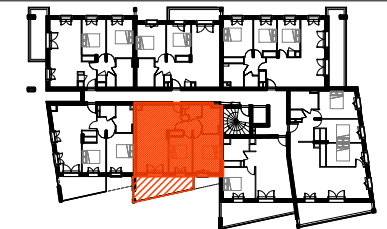
Plans de repérage

La surface des placards est incluse dans les surfaces des pièces attenantes