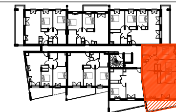
Plans de repérage

La surface des placards est incluse dans les surfaces des pièces attenantes