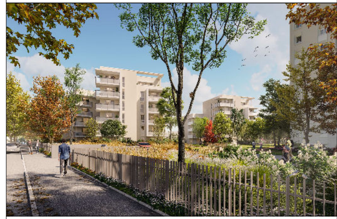
Bâtiment JARDIN - R+3 - N°305J - T3